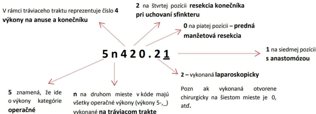
Obrázok 1 – príklad štruktúry kódu pre vybraný konkrétny operačný ZV na tráviacom trakte.